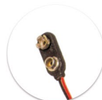
BH 9V Clip