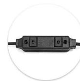
Cabo X Cable X