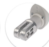
Garfo Diânteiro Metálico Anclaje Delantero Metalico

Comandos manuais e unidades de comando devem ser adquiridos separadamente. Ver páginas 08 a 11. Mandos y cajas de control deben de ser adquiridos por separado. Mirar paginas 08 hasta 11.