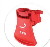
Alavanca Vermelha Palanca Roja