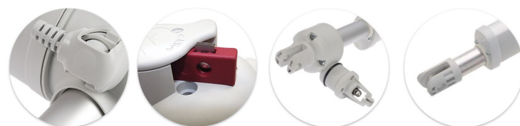
Cabo do motor plugável Cable desconectable del motor