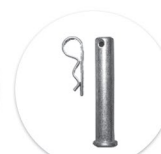
Pino + Clip Pino + Clip