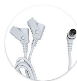
Cabo Y - DIN 13 Cable Y - DIN 13