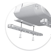
Pés de fixação MC 15 Pies de fijación MC 15