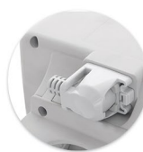
Cabo de Alimentação Plugável Cable del Alimentación Plugable