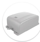
Bateria BP1 Bateria BP1