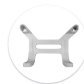
Kit Fixação MC 15 - MCZ Kit Fijación MC 15 - MCZ