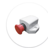
Botão de Emergência Boton de Emergencia

Comandos manuais devem ser adquiridos separadamente. Ver páginas 10 a 11. Mandos deben de ser adquiridos por separado. Mirar paginas 10 hasta 11.