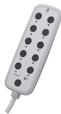
I PROXX ZB4 11 I PROXX ZB6 11 *Imagem Ilustrativa