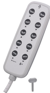
I PROXX 2 C4 10 SM