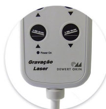
Gravação a Laser Grabación Laser