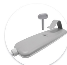
I PROXX 2 C4 10 SM - Com bloqueio I PROXX 2 C4 10 SM - Con bloqueio