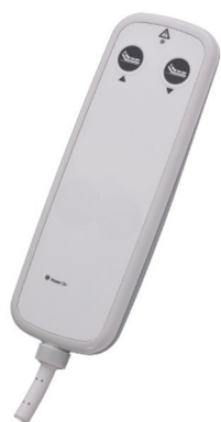
I PROXX 2 C1 02