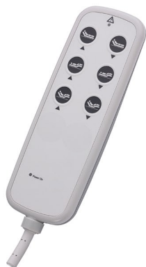
I PROXX 2 C2 06