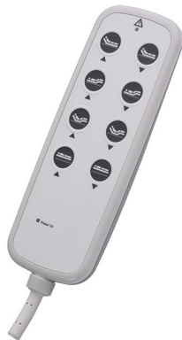
I PROXX 2 C3 08