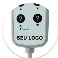
Membrana Personalizada Membrana Personalizada